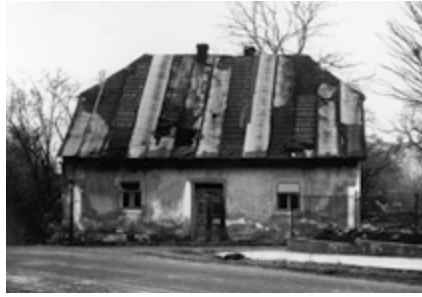
Dům čp. 75 v Železnické ulici těsně před demolicí. 70. léta 20. století