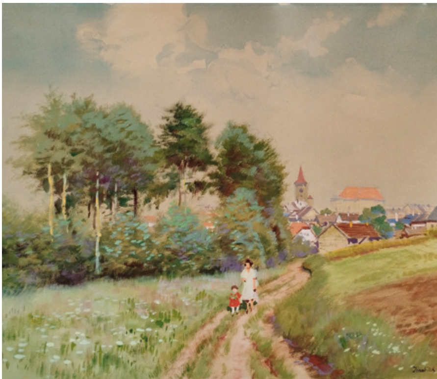
Jindřich Procházka, Cesta k Jičínu, 1943, akvarel, papír, 38 x 55 cm (Sbírka RMaG v Jičíně).