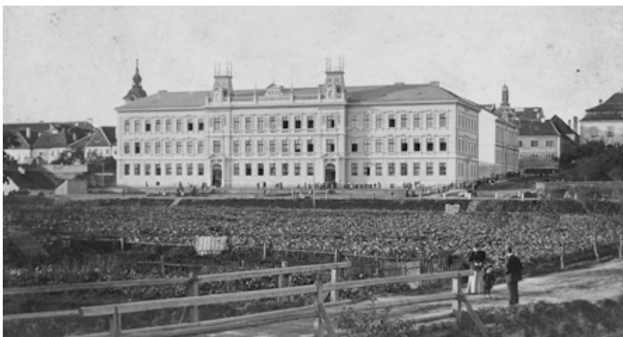
V letech 1894–1896 na místě zámecké zahrady byla vystavěna budova chlapeckých a dívčích obecních a měšťanských škol, foto Josef Pícek, 1896–1904. V roce 1904 bylo přistavěno východní křídlo v proluce mezi školou a spořitelnou.

Situace jičínských škol se ještě zhoršila v závěru války. Rok 1945 byl pro místní školství mimořádně těživý. Koncem ledna byly v Jičíně zřízeny lazarety německého vojska a v dubnu byly k tomuto účelu poskytnuty také prostory obecních a měšťanských škol.