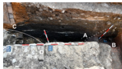
Stratigrafické odlišení dvou stavebních fází komplexu brány v jižní části sondy (A – průběh původního příkopu, B – dubový kůl na hraně příkopu, pravděpodobný relikv nejstaršího dřevěného mostu, C – rub klenby a založení mladšího kamenného mostu do příkopu).