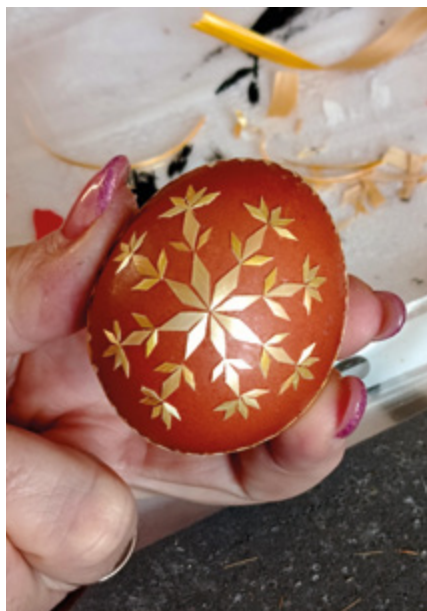
Slaměný workshop na faře v Robouších. Zdobení kraslic slámo.