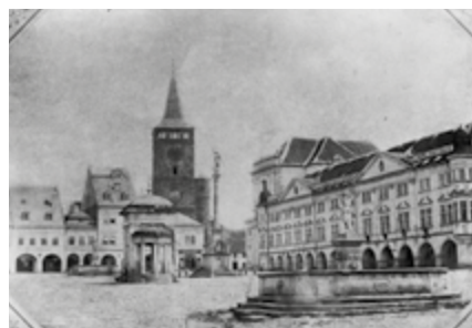
Velké náměstí (dnes Valdštejnovo) mělo na konci 19. století 2 kašny – Neptunovu a kašnu se sochou Amfitrité, 1870, kopie (Sbírka RMaG v Jičíně).

Poštovní úřad byl v letech 1794–1877 umístěn v domě zvaném Stará pošta (čp. 46) na Holínském předměstí. Od roku 1864 měl Jičín také telegrafní úřad s linkou vedoucí z Prahy přes Sobotku a Jičín do Josefova.