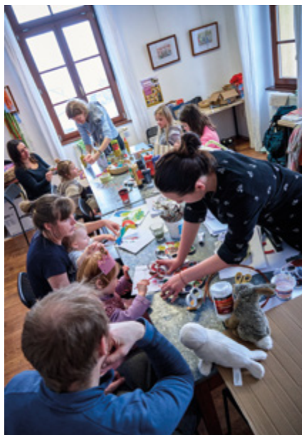
Masopust 2026. Masopustní dílny na faře v Robouších.