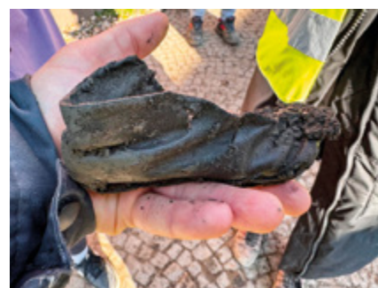
Ve výplni příkopu pod kamenným mostem se podařilo nalézt koženou dětskou botičku ze 17. století.