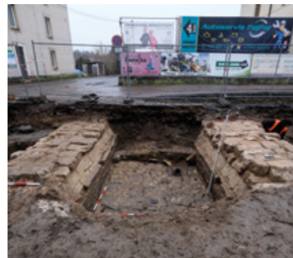
Základy jednoobloukového kamenného mostu z přelomu 18. a 19. století před Grossovým mlýnem.

Druhá fáze výzkumu přinesla zásadní poznatky k podobě městského opevnění v prostoru zaniklé Velišské brány. Byla zde odkryta téměř kompletní situace fortifikačního systému, zahrnující ve své první stavební fázi více než 8 m široký a 3,4 m hluboký příkop, mohutný kamenný základ hradby a relikty dřevěného mostu, založeného na dubových pilotách. Kolem poloviny 15. století došlo k výrazné přestavbě tohoto prostoru, kdy byla Velišská brána doplněna o kamenný most a vysunutě předbrání: jižní část příkopu byla částečně zasypana a do jeho prostoru byl vložen jednoobloukový kamenný most, přisazený ze severní strany přímo k tělesu brány, zatímco na jižní straně na něj navazovalo diagonálně vysunutě předbrání, tedy předsunutý fortifikační prvek chránící vstup do města před přímým postřelováním a zároveň kontrolující přístup po komunikaci vedené po hrázi přilehlého rybníka. Podle historických pramenů patřila Velišská brána k trojici hlavních městských bran Jičína a zajišťovala spojení ve směru na Prahu; spolu s Valdickou a Holínskou bránou tvořila základní komunikační osu města, doplněnou o menší fortny. Brána byla součástí souvislého pásu kamenných