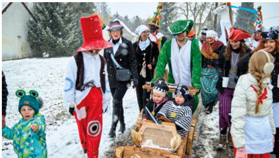
Masopust 2026. Průvod v dolních Robouších.