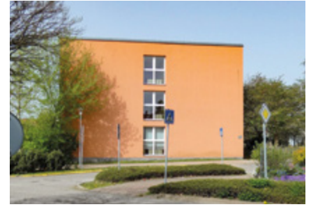
Jeden z pavilónů ZŠ Železnická, který stojí na místě původního čp. 75.

sklonku 70. let 20. století. Postavena měla být nová budova pro 4. základní školu, která se stále potýkala s problémem umístění jednotlivých tříd. Třídy byly prakticky rozptýleny po celém městě, žáci jedné z nich dokonce museli jezdit do Holína. Nové pavilóny pro školu, která tehdy měla 22 tříd, byly slavnostně předány do užívání 30. srpna 1980. Jednotlivé pavilóny, které jsou propojeny chodbami, měly být tehdy