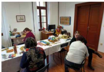
Textilní workshop na faře v Robouších. Staré textilní techniky.