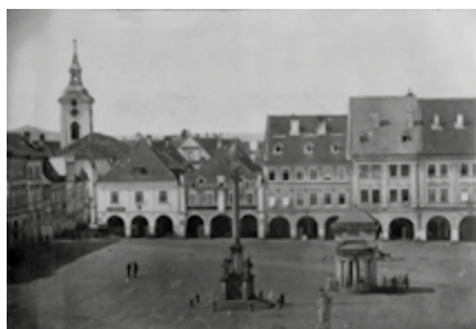
Západní strana Velkého náměstí (dnes Valdštejnovo) v Jičíně, před 1880.

V polovině 19. století umístění všech jičínských škol naprosto nevyhovovalo a nepostačovalo. Jičínská obec se proto rozhodla vybudovat samostatnou školní budovu.