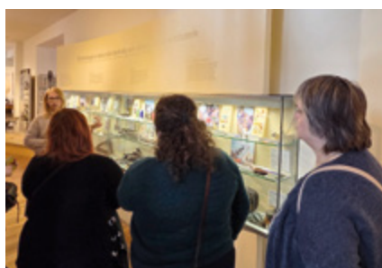
Jičínští muzejníci na exkurzi v Muzeu skla a bižuterie v Jablonci nad Nisou.