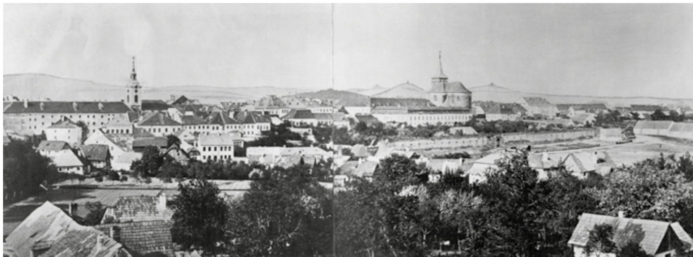
Pohled na Jičín z věže novoměstského kostela, 1866.