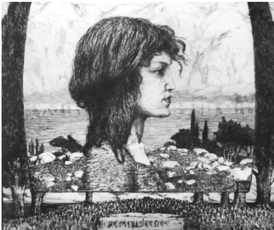
Tavík František Šimon, Reminiscence, 1899, lept, papír.