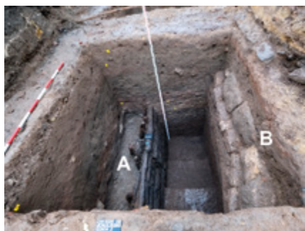
Pohled do jedné ze sond v ulici Ruská (A – relikty roubené konstrukce hráze starší fáze Špitálského rybníka, B – kamenná tarasní zeď koruny hráze).