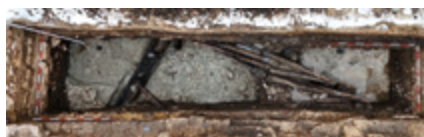
Další relikty dřevěných konstrukcí souvisejících s vodohospodářským systémem v prostoru dnešní křižovatky.