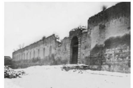
Jižní brána bývalého zámeckého komplexu, pohled od východu k západu, místo připravované pro stavbu školy na dnešní ulici 17. listopadu. Fotografie zhotovil Josef Pícek, 1894.

Do života školy opakovaně zasáhly také válečné události 20. století. Po mobilizaci v červenci 1914 byly všechny školy ve městě zabrány vojskem. Budova obecních a měšťanských škol byla rovněž obsazena a národním školám tak zůstala k dispozici pouze novoměstská obecná škola. Výuka byla v důsledku těchto opatření přerušena od 26. července 1914 do 31. srpna 1917.