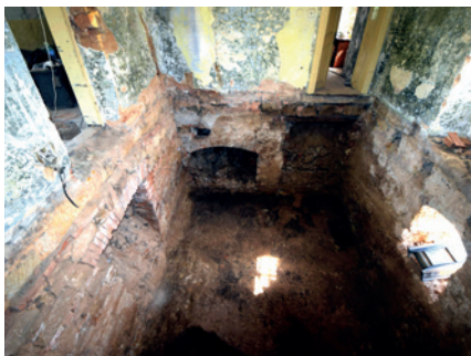
obr. 2 Pohled do nově odkrytého „velkého sklepa“ po odtěžení zásypů. Na protější straně vidíme vpravo vstup do dalších suterénů tvrze, vedle je krb či černá kuchyně a vlevo je mladší příčka vložená do sklepa asi při první přestavbě na faru v 18. století.

První zmínka o tvrzi se váže k Janovi či Ješkovi ze Samšiny z roku 1359–1361, v průběhu 14. a počátku 15. st. se na tvrzi vystřídal více majitelů, poté se písemné prameny o Samšíně odmlčují až do r. 1505, kdy se dozvídáme, že Hanuš ze Samšiny vypravil do války proti Šlikům vůz a čtyři pěší bojovníky. Z dalších pánů na tvrzi uvedme alespoň Abrahama Gerštorfova z Malšvic, který je se ženou Annou pohřben v samšinském kostele, nakrátko tvrz později získal i Albrecht z Valdštejna. V pohnutých letech třicetileté války byla Samšína mezi léty 1631 až 1648 několikrát vyplněna při vpádech švédských posádek z Hrubé Skály a Grabštejna. V roce 1643 je tak tvrz a statek v Samšíně „velmi zruinovaný“ prodán Fridrichovi Karlu Hubkovi z Hennerstorfu, který se snažil tvrz opravit a samšinskému kostelu věnoval velký zvon. Později se na Samšíně objevuje Jindřich Leveneur, rytíř von Grünwall, který byl císařským tajným radou, soudcem a který se