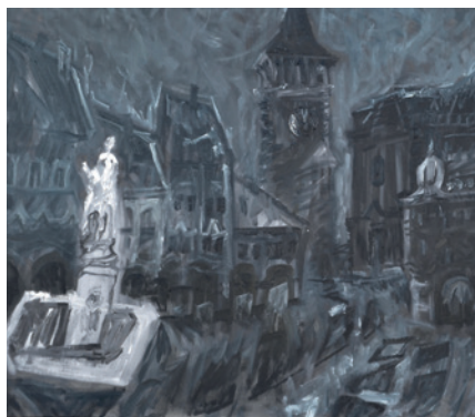
Kašna (z cyklu Noční procházky), 2012, olej na plátně, 70 x 100 cm.

Jeho práce se odehrává v cyklech, kdy autor vypráví a nahlíží příběh z mnoha různých pohledů. Tentokrát se tématem jeho práce stal průzkum tajemství a zákoutí života i díla mimořádného literáta počátku 20. století Franze Kafky. Cyklus začal vznikat již v roce 2013, kdy malíř vytvořil nejprve komorní cyklus 24 obrazů menšího formátu, v nichž se pokusil o jakousi malířskou definici Kafkova života, tvorby a světa. Proplínají se zde znaky odkazující k biografii spisovatele, jeho dílu, ale zároveň paralelně zaznívá souzvuk s životem a údělem malíře samotného. Soubor tedy není koncipován jako ilustrace konkrétního Kafkova díla, nebo děl, ale snaží se o obecnější definici údělu autora zmítaného pochybnostmi,