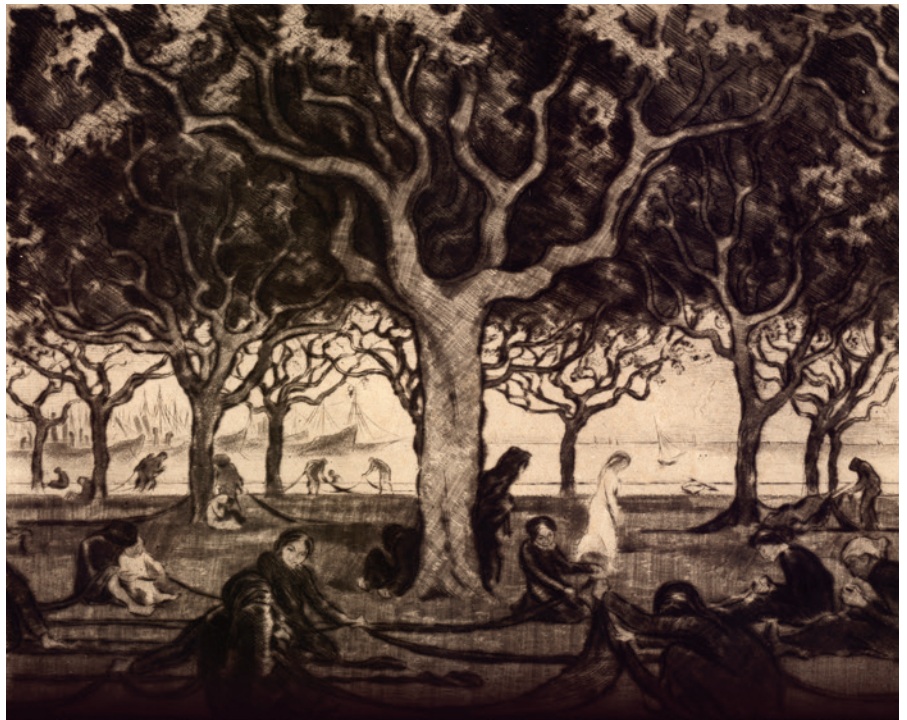
Vladimír Silovský, Rozplétání sítí, suchá jehla, papír, 230 × 283 mm (Sbírka RMaG v Jičíně).