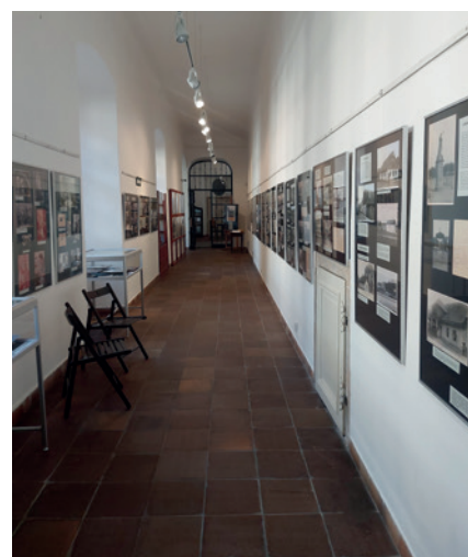
Výstava Ateliér Podlipný ve výstavní chodbě muzea.