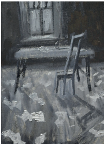
Krátká povídka (z cyklu Deníky F. K.), 2013, olej na plátně, 40 x 30 cm.

palčivou touhou po dokonalosti, nespokojeností se sebou samým. Zachycuje nekonečné hledání univerzálního principu i zcela ojedinelé subjektivní tendence determinující podstatu či povahu tvorby jako takové. Vypovídá o každodenním úsilí po dosažení sumární bezchybnosti i postižení jemného, avšak podstatného detailu.