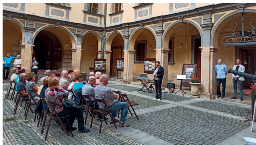
Po více než roce bylo v našem muzeu opět možné uspořádat vernisáž. Snímek zachycuje zahájení výstavy Ateliér Podlipný .