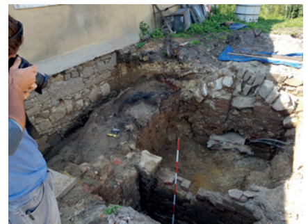
obr. 4 Sonda před hlavním vchodem s nově odkrytým sklepem a dochovanými požárovými horizonty po stranách.

Archeologický výzkum zatím přináší stále nové poznatky o možných stavebních fázích tvrze. Nejprve při odtěžení zásypů v místnostech za hlavním vchodem byly v hloubce 2,5 m identifikovány znovu objevené suterénní prostory tvrze s dochovaným vstupním portálem do východní části tvrze a sklepů v západní části, okno do jižního průčelí a topeniště na způsob černé kuchyně či krbu (viz obr. 2). Byla zde identifikována pochozí úroveň z horizontu 14. a 15. století, tedy z doby, která spadá