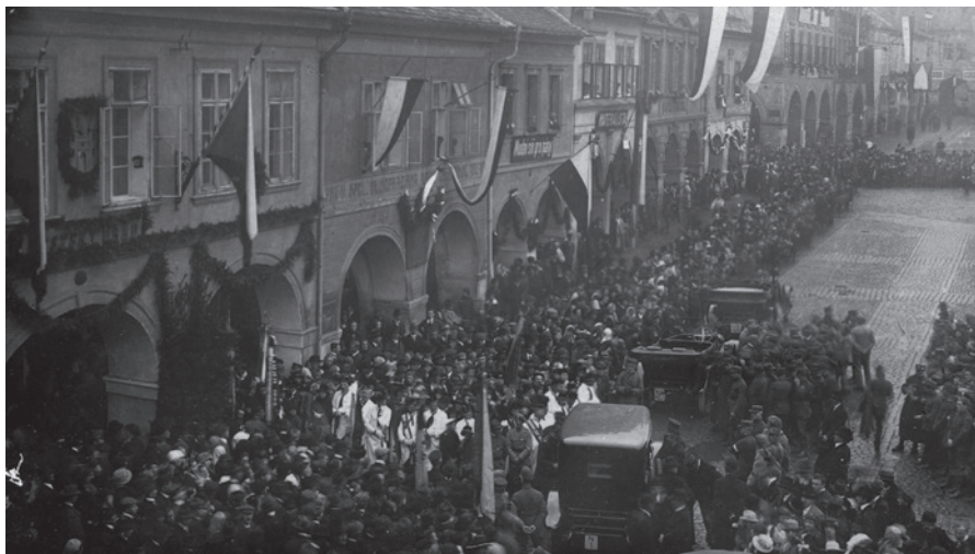
Příjezd prezidenta Masaryka k jičínské radnici, 22. 10. 1921.