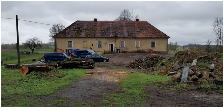
obr. 1 Dnešní podoba tvrze v Samšíně před zahájením rekonstrukce, pohled na hlavní jižní průčelí tvrze.