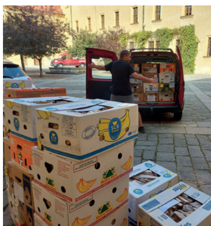
Začalo stěhování sbírky jičínského muzea do nového depozitáře v Roubousích.