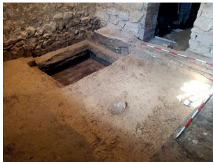
obr. 3 Jáma s dřevěným roubením ve velkém sklepe, která pravděpodobně sloužila pro chlazení potravin či mladiny při vaření piva.

vyznamenal v bitvách s Turky u Harkáně, Ostřihomi a Moháče, odkud dokonce přivedl na Samšinu tři zajaté Turky. Ještě před rytířovou smrtí přechází tvrz roku 1709 do majetku hraběte Františka Josefa Šlika z Holiče. Ten roku 1739 odevzdal faráři k obývání tvrz „na polo pobořenou“ a následujícího roku je zde zřízena fara. Při přestavbě na faru víme, že bylo sneseno zchátralé první patro a zůstala tak jen přízemní obdélníková budova, krytá valbovou střechou. Z původní tvrze tak měly být dochovány pouze tři valené klenuté sklepy a část obvodového zdiva s renesančním vstupním portálem. Fara zde fungovala do roku 1950 a poté byla až do roku 2004 využívána jako JZD.