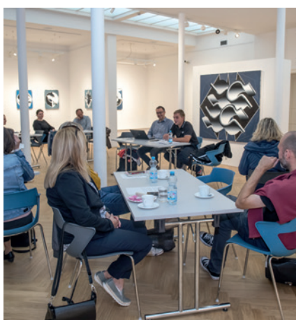
Setkání krajských sekcí AMG ČR Královéhradeckého a Pardubického kraje se uskutečnilo 4. října v Hořicích.