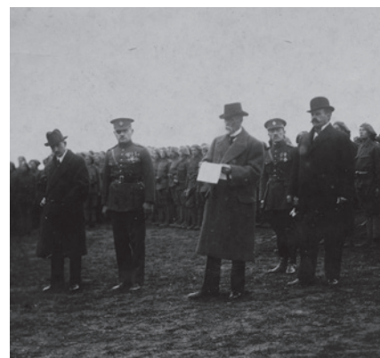
Prezident Masaryk na vojenském cvičišti pod Čefovkou. Zleva E. Beneš, generál J. Syrový a ministr národní obrany Fr. Udřal, 22. 10. 1921.