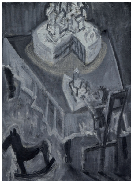
Zámek (z cyklu Deníky F. K.), 2013, olej na plátně, 40 x 30 cm.