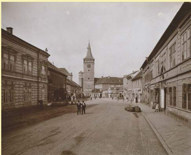
Pohled na Žižkovo náměstí z Husovy ulice, foto Josef Pícek, po roce 1883.