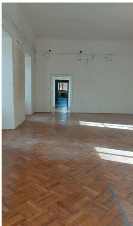
A takto dopadla kompletní deinstalace stálé expozice před rekonstrukcí...