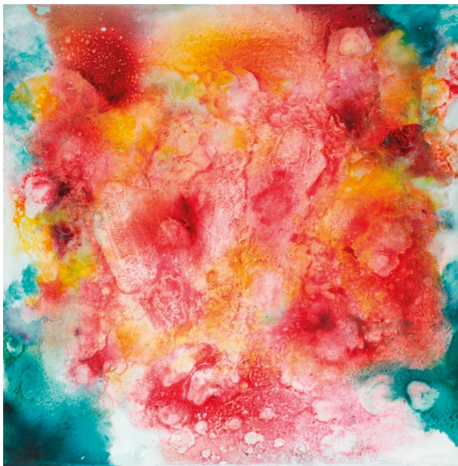
Zpěv podzimu, 2022, olej, plátno.