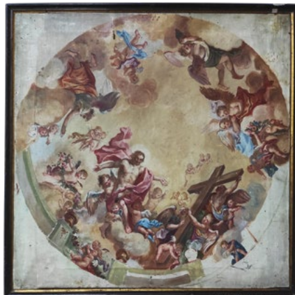
Obraz pořízený H. A. Jouklem zachycující Supperovu freskovou výzdobu presbytáře kostela Nanebevzetí Panny Marie ve Slatinách.