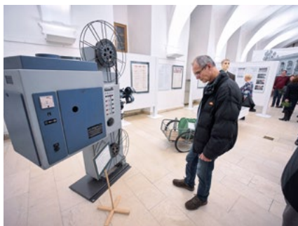
Výstava Bio má narozeniny.