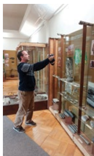
Dokumentace expozice před rekonstrukcí.