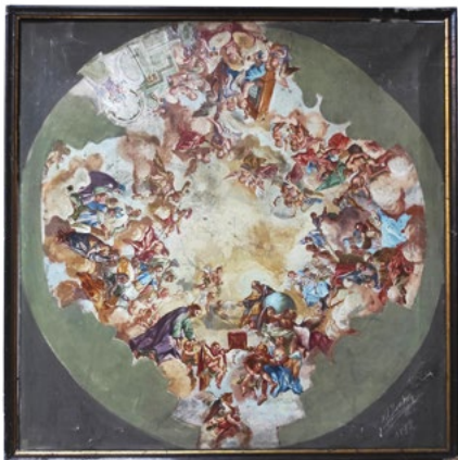
Obraz pořízený H. A. Jouklem zachycující Supperovu freskovou výzdobu kupole kostela Nanebevzetí Panny Marie ve Slatinách.