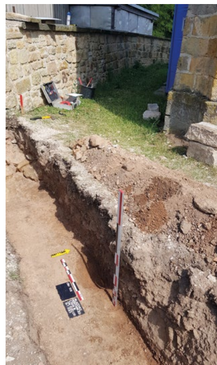
Obr. 2 – Sonda při západní straně kostela odhalila starší zděnou konstrukci a kůlovou jamku snad související s hospodářským zázemím tvrze.

Naši zaměstnanci v lednu započali se zahraničními vzdělávacími výjezdy v rámci projektu ERASMUS+. Naše archeoložka se zúčastnila kurzu na univerzitě v Pise a nyní se archeologové odjeli vzdělávat do Národního muzea v rumunské Kluži.