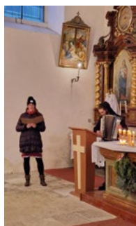
Adventní odpoledne na faře v Robousích.