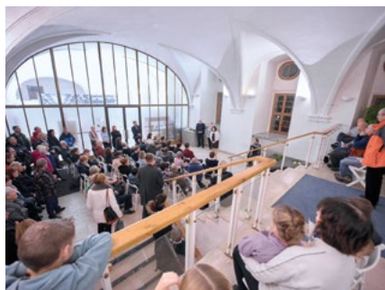
Vernisáž výstavy Bio má narozeniny.