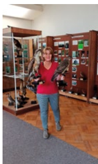
Deinstalace expozice před rekonstrukcí.