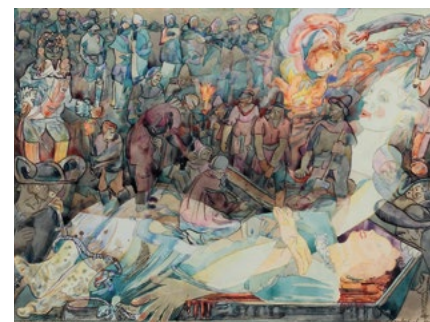
Josef Váchal, Jičínský upír, 1954, kombinovaná technika, papír, 41, 5 × 55 cm (Sbírka RMaG v Jičíně).