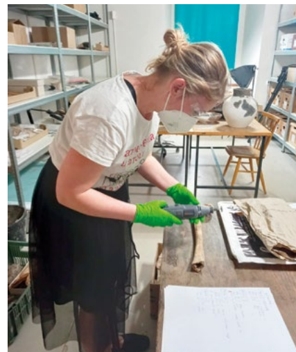
Odebírání vzorků z kosterních nálezu pro izotopové analýzy v jičínském muzeu.

Většina panelů je vybavena QR kódy, po jejichž naskenování fotoaparátem v mobilu se spustí doprovodná videa, 3D počítačové modely nálezu či virtuální procházka.