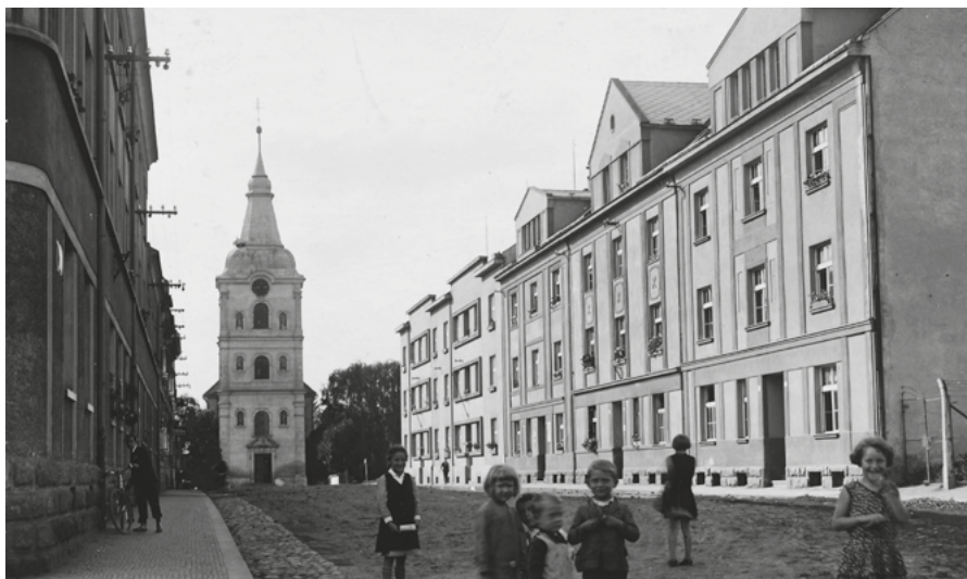
Barákova ulice, téměř všechny činžovní domy byly postaveny ve 20. letech 20. století, pohlednice, kolem 1930.