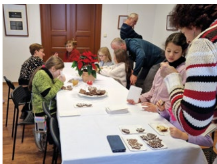
Adventní odpoledne na faře v Robousích.