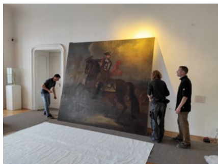
Obraz Valdštejna poputuje na čas rekonstrukce do depositáře.