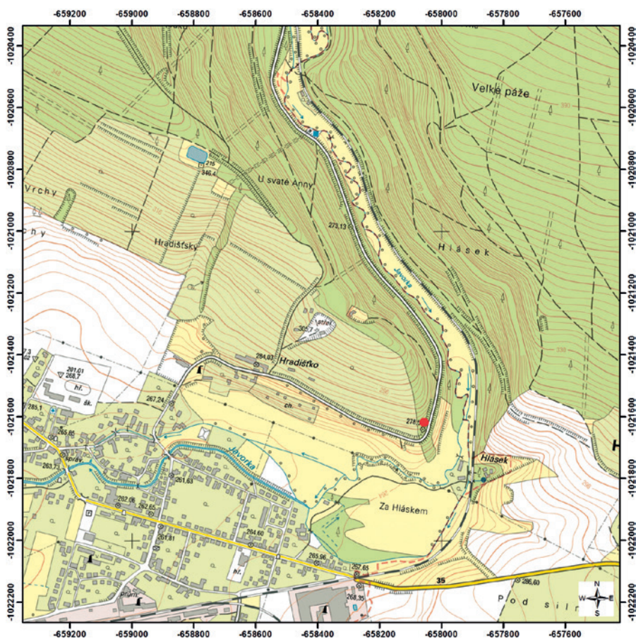
Obr. 1. Výřez z mapy 1: 10 000, pohled na ostroměřské hradiště. Červený bod označuje polohu lomu Pourouva skála.

Ostroměřské hradiště se rozprostírá na jižním svahu Mlázovického Chlumu, severovýchodně od obce Ostroměř, v poloze Hradištsko. Je situováno na rozsáhlém terénním bloku (v nadmořské výšce 270–340 m n. m.), který je ze severu, severovýchodu a jihu obtékán říčkou Javorkou (obr. 1). Od roku 1958 je hradiště památkově chráněno.