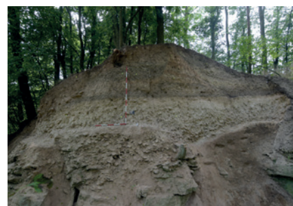
Obr. 4. Pozůstatky obvodové hradby po začištění.