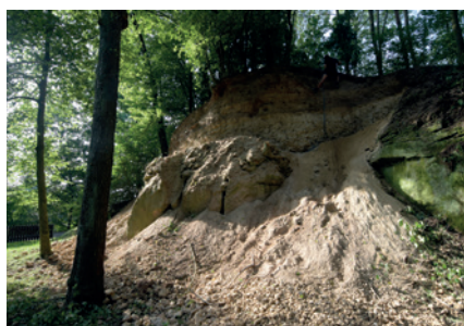
Obr. 3. Pracovní foto ze záchranného výzkumu v lomu Pourouva skála.