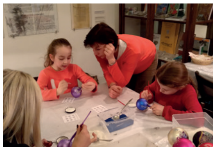
Vánoční dílny pro žáky základních škol.