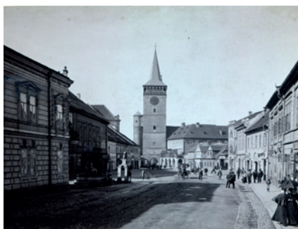
Pohled na Žižkovo náměstí z Husovy ulice, po roce 1883.