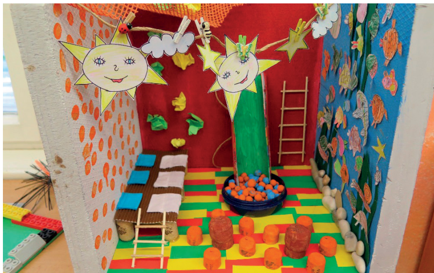
Pokojíček se sluníčky, tvorba žáků základní školy v rámci projektu Místní akční plán rozvoje vzdělávání pro ORP Jičín (projekt MAP).