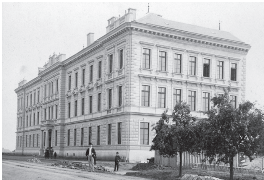
Budova učitel'ského ústavu, foto Josef Pícek, před 1889 (Sbírka RMaG v Jičíně).