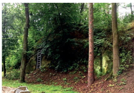
Obr. 2. Pohled na porušený val v lomu Pourouva skála před zahájením záchranného archeologického výzkumu.