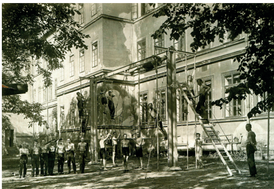
Letní tělocvična učitel'ského ústavu, 1927 (Sbírka RMaG v Jičíně).

V období 1. světové války plnilo pedagogium svou funkci jen omezeně, stejně jako ostatní školy v Jičíně. Místa vzdělávání sloužila většinou jako ubytovny pro vojáky domobrany. V učitel'ském ústavu byla výuka částečně obnovena teprve v září 1916. Hned na počátku 2. světové války (16. 3. 1939) se ve škole ubytovalo 80 německých vojáků a na dvůr vzniklo parkoviště motorizovaných oddílů. Na krátkou dobu se škola stala dokonce sídlem místního velitelství Ortskommandatur. V roce 1943 došlo k dalšímu omezení fungování školy, kdy byla do ústavu přemístěna obecná škola dívčí a v roce následujícím gymnázium. Budovy škol se totiž postupně měnily na lazarety. Když se po stěhování škol konečně začalo vyučovat, byla 3. 11. 1944 zabrána pro válečné účely i budova reálky, budova učitel'ského ústavu a nová budova učňovských škol. Poslední válečnou změnou své funkce prošel učitel'ský ústav na konci ledna 1945, kdy byla budova školy vyklizena a byl zde zřízen lazaret německého vojska.