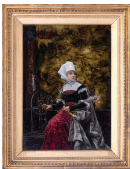
Václav Brožík, Přadlena, nedatováno (Sbírka RMaG v Jičíně).

Ladislav Karoušek, Zimní slunce, 1982, olej na plátně, 81 × 100 cm Komentovaná prohlídka: 13. února 2018 od 16.30 hod.