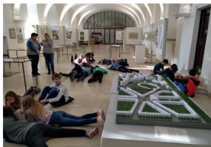
Žáci na komentované prohlídce výstavy Architekt Čeněk Musil.