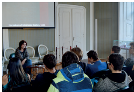
Žáci Střední průmyslové školy na přednášce o Valdštejnovi.